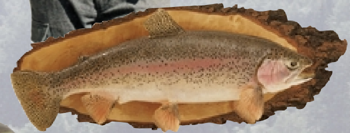
Trota iridca Montaggio su pannello a parete