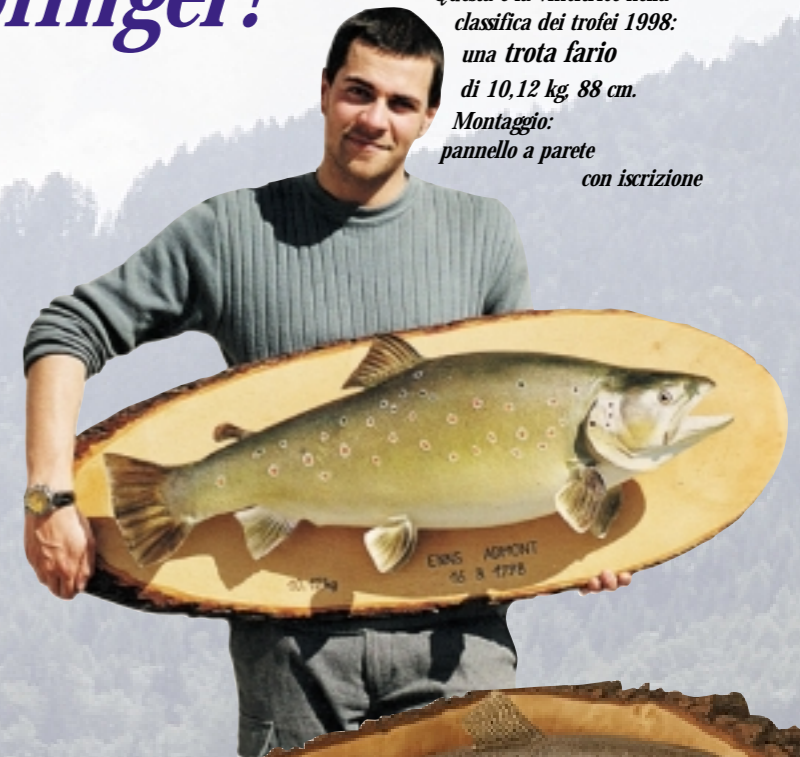
Questa è la vincitrice nella classifica dei trofei 1998: una trota fario di 10,12 kg, 88 cm. Montaggio: pannello a parete con iscrizione